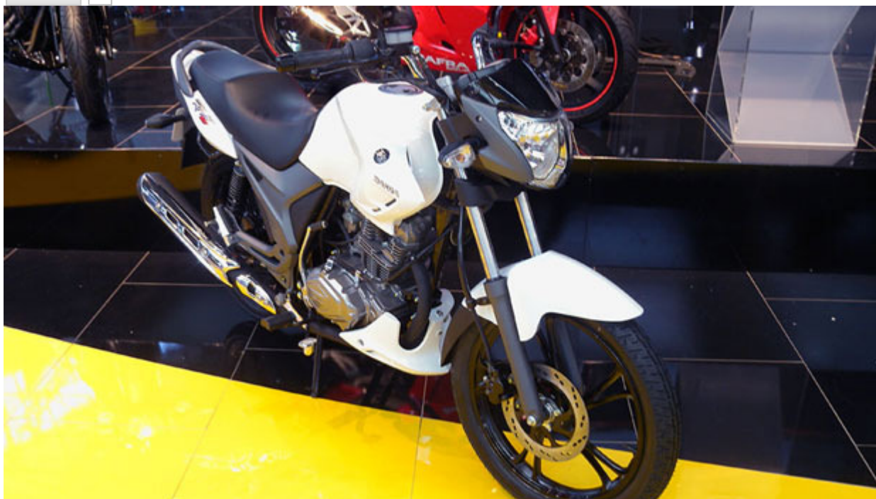
Dafra Riva 150